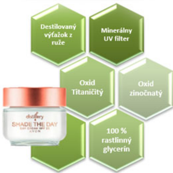
Denný krém s OF 25 Distillery